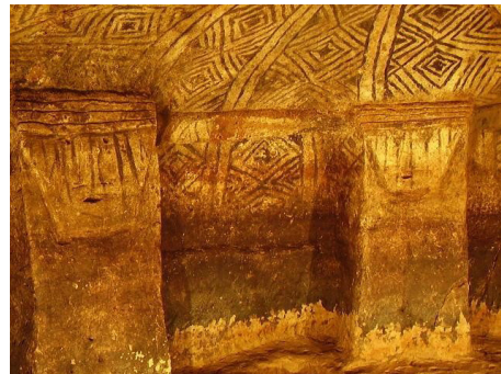
Figura 2. Algunas configuraciones con romboides que se encuentran en el Parque.

El rombo, o mejor romboide para este caso, es la figura geométrica de mayor empleo en los diseños. Él, no siempre fue creado como unidad sino que apareció como consecuencia de alguna construcción geométrica, es decir, aparecían por la intercepción de la familia de líneas paralelas oblicuas hacia la izquierda al interceptarse con la familia de líneas paralelas oblicuas hacia la derecha, aunque dependiendo la estructura del hipogeo esto puede cambiar. Estos romboides manejan distintos grados de nivel de concentricidad y combinación tanto cromática como de poligonales y superficies, como se puede ver, a manera de muestra, en la siguiente Figura.